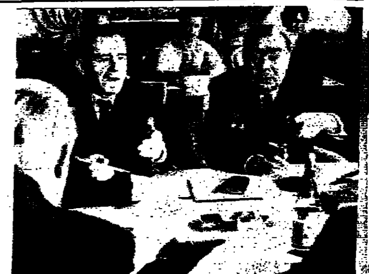
الزعيم السوفياتي بريجنيف مع رئيس وزراء بريطانيا هارولد ولسون (صورة بالترتيب من اليمين)